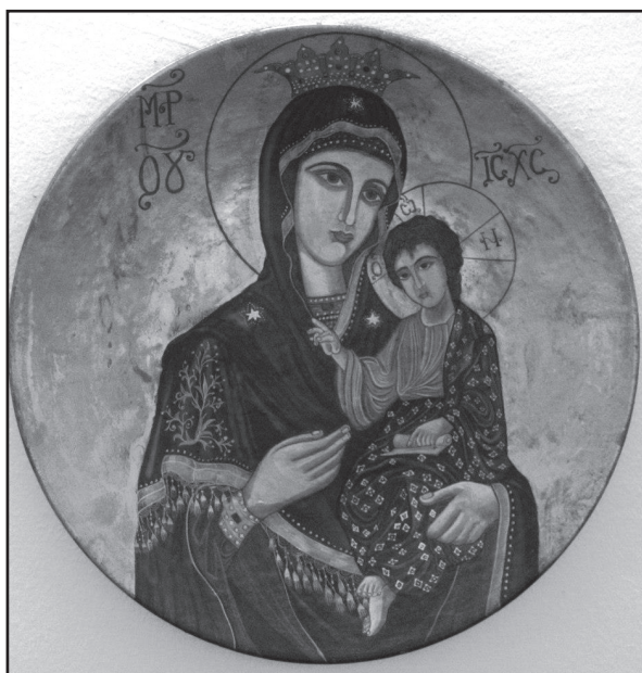
Јазмина Кланица, Богородица са Исусом Христосом , комбинована техника на бакарном тањиру, пречник 30 цм, 2006. година

Key words: Ignjat Pavlas, The Great National Assembly of Serbs, Bunjevci and other Slavs in Banat, Bačka and Baranja, First World War, Serbian National Council, Novi Sad